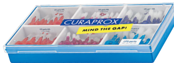
Chairside Box «perio» Artikel-Nr. 73345330