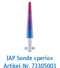
IAP Sonde «perio» Artikel-Nr. 73305003