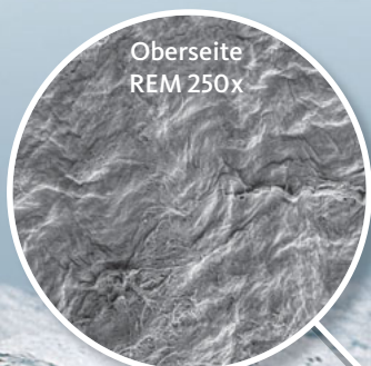
Oberseite REM 250x