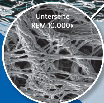
Unterseite REM 10.000x